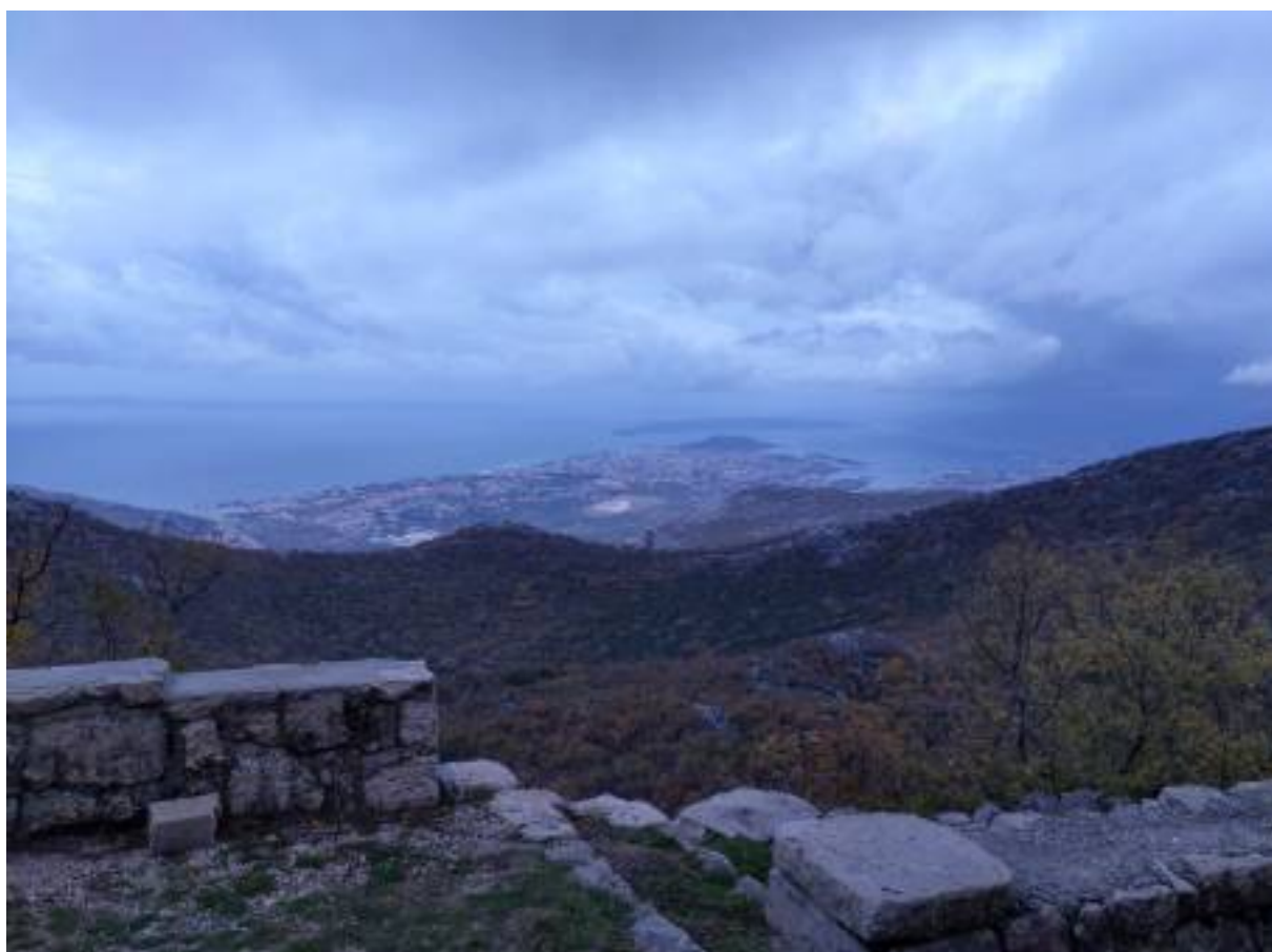
Prilaz na vrh planine. Na vrhu su ostaci starog rimskog utvrđenja. Udaljenost od Lugarnice je oko 10 km. Na vrhu su i dva stabla vrapidrva.