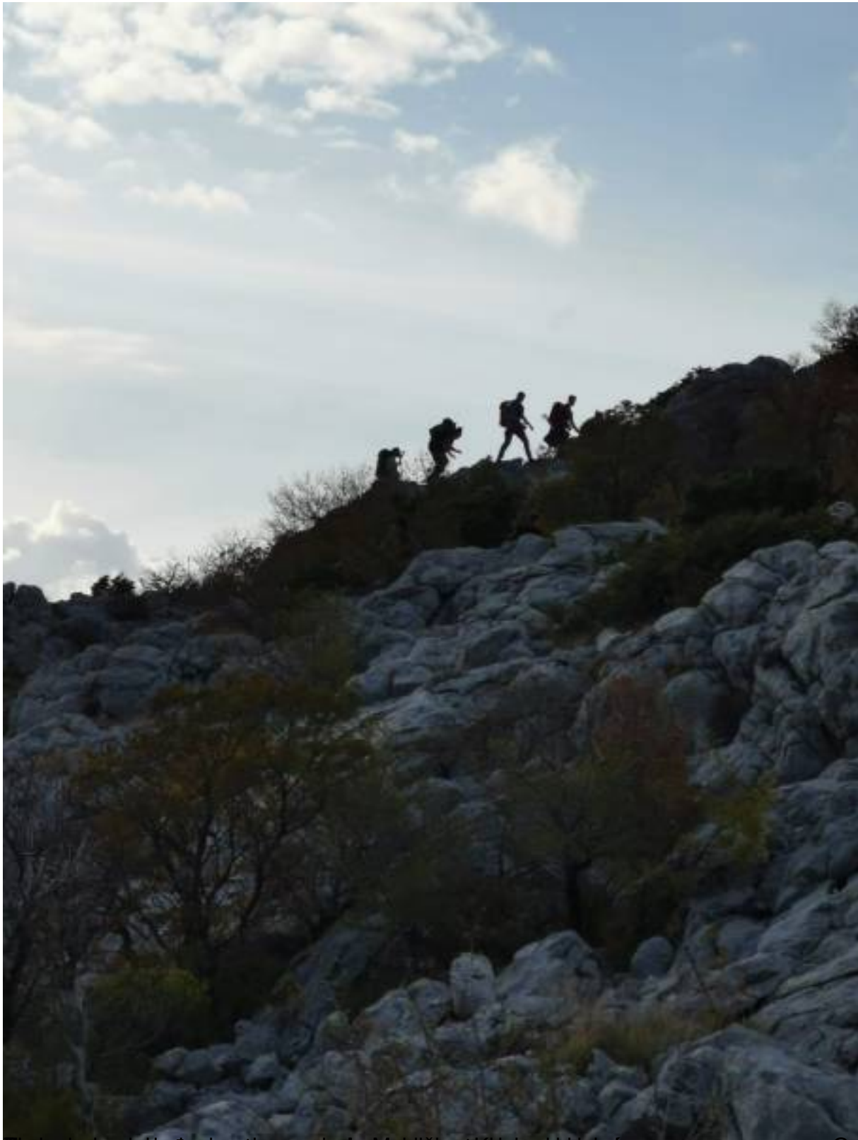
Preznanje bosanskohercegovačkih planinara, gledajući iz Škvrčine, kada se prvi put pojavio se prvi sezona Game of Thrones