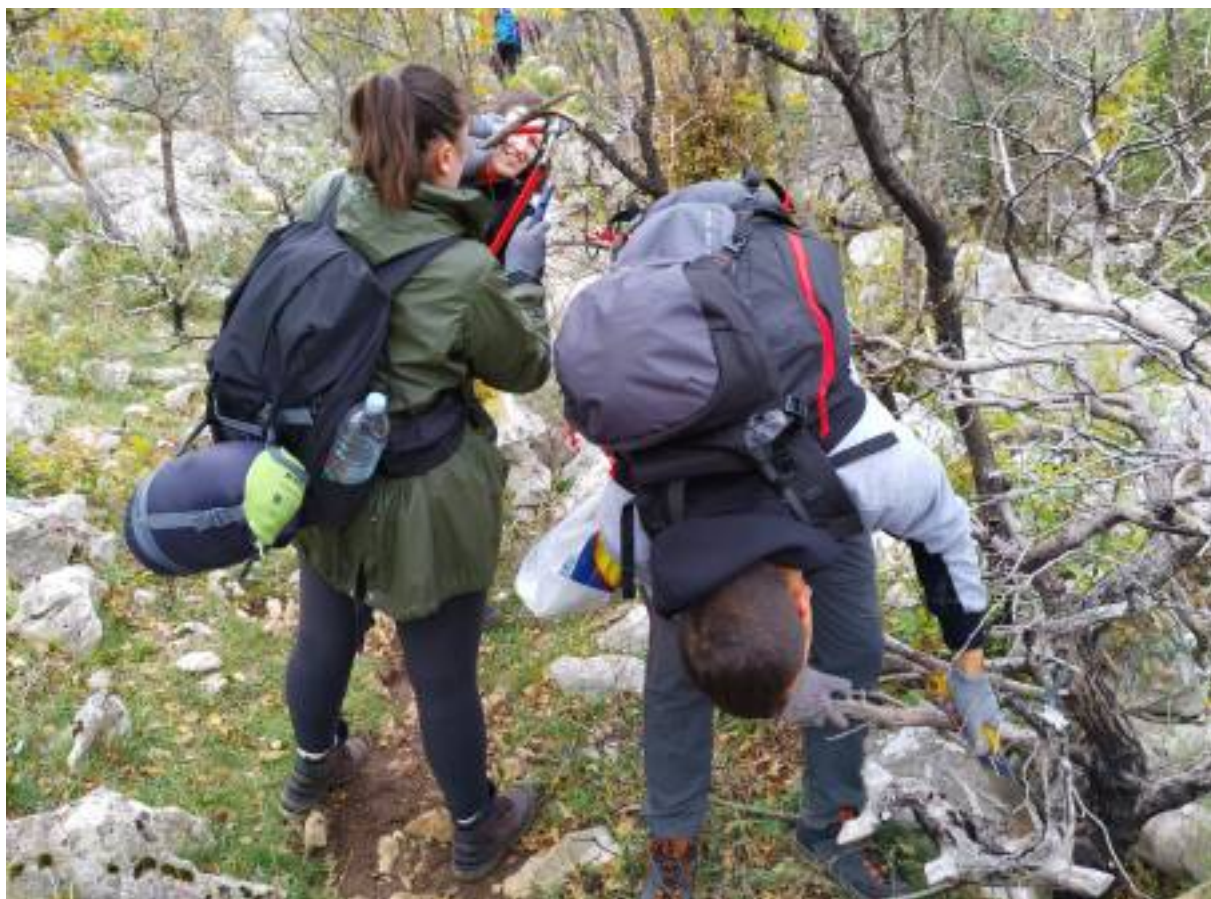
Stolping i skopje pri spuštanju sa stijega u blizini sela Čučarjeva, grupa iz Planinarske škole