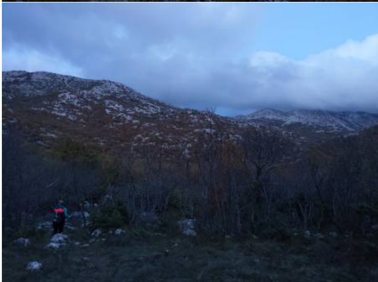
Prezvali gotazakre da re dšate i sve gja pa soz sa dšekal i asitak ekipe koje smo potajice