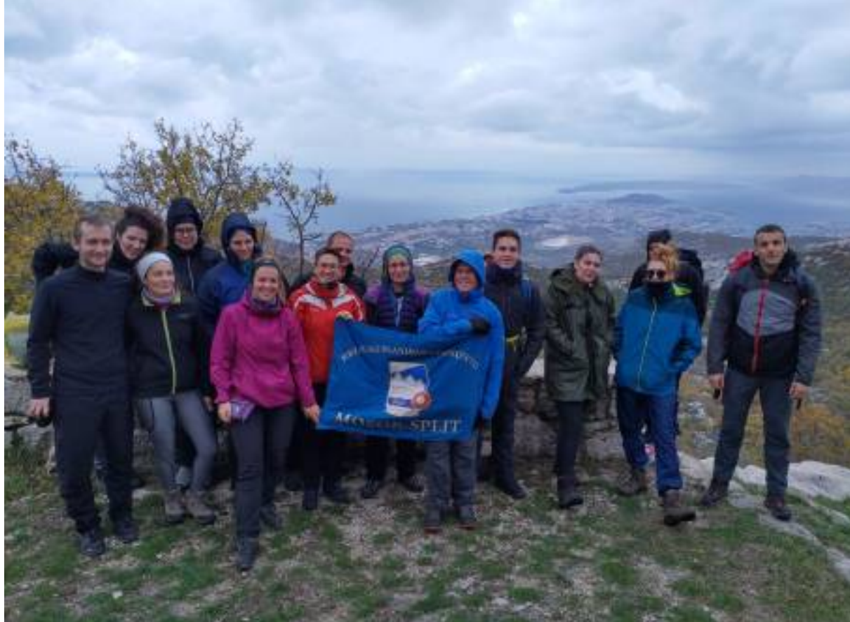
Malo smo se odmorili, pripremili ruksake te uputili na rendes s umjetnicima crveno-bijele boje.