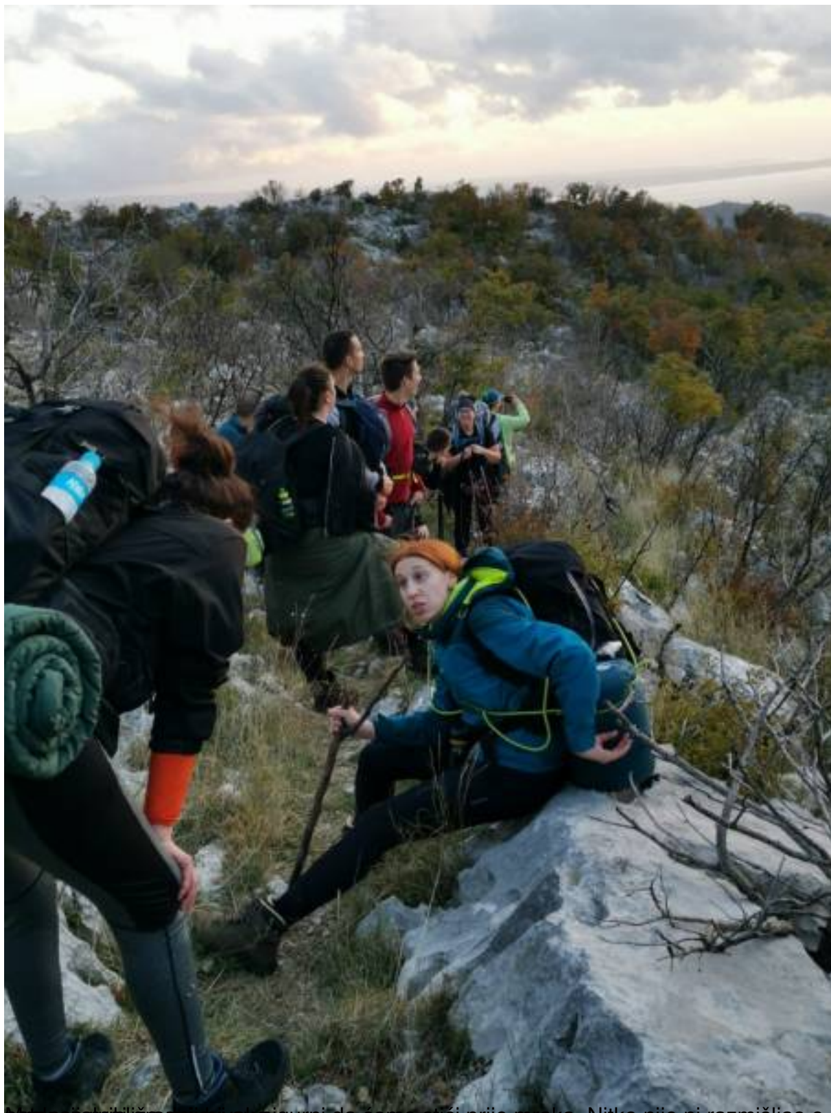
svatko se ponašao sigurni da ćemo stići prije mraka. Nitko nije ni razmišljao o