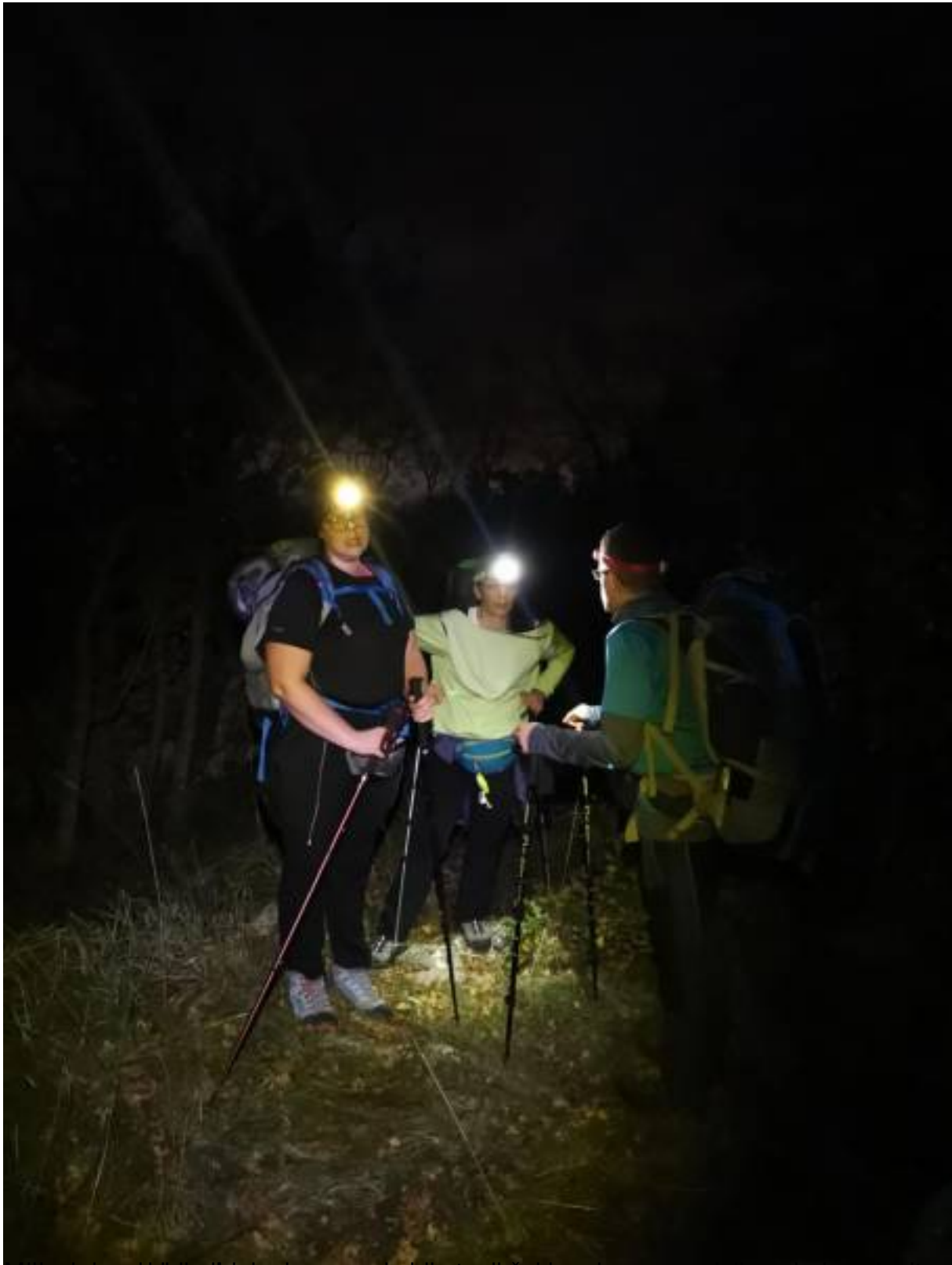
preko snježne pokrivenosti. je nagrada bila topli čaj i prekrasan zadnji pogled na Jupiter i Veneru