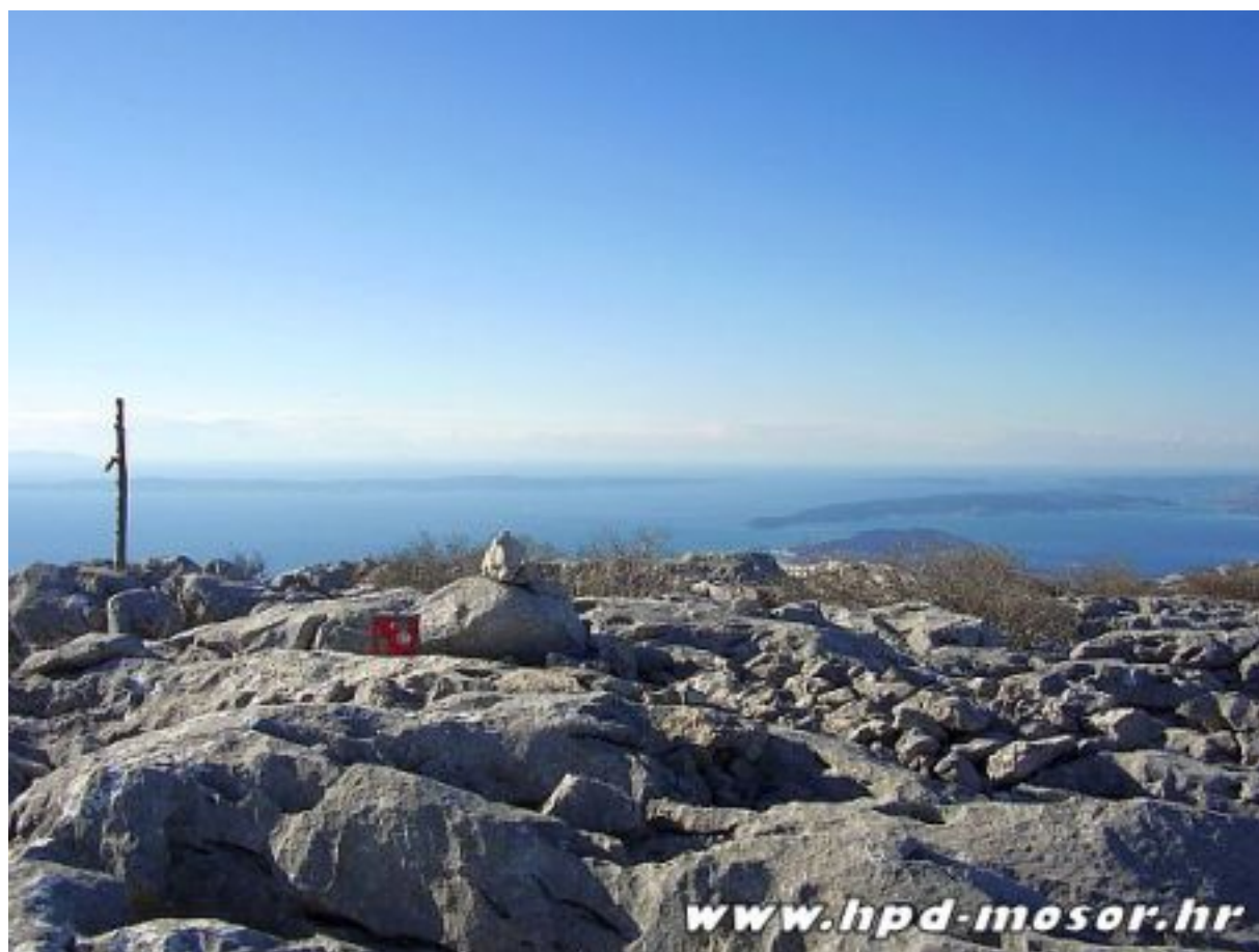
Sl. 1 Pogled s vrha

Debelo brdo (1044 m) je najzapadniji istaknuti vrh na Mosoru i, zahvaljujući položaju, jedan od najljepših vidikovaca na našem Mosoru.