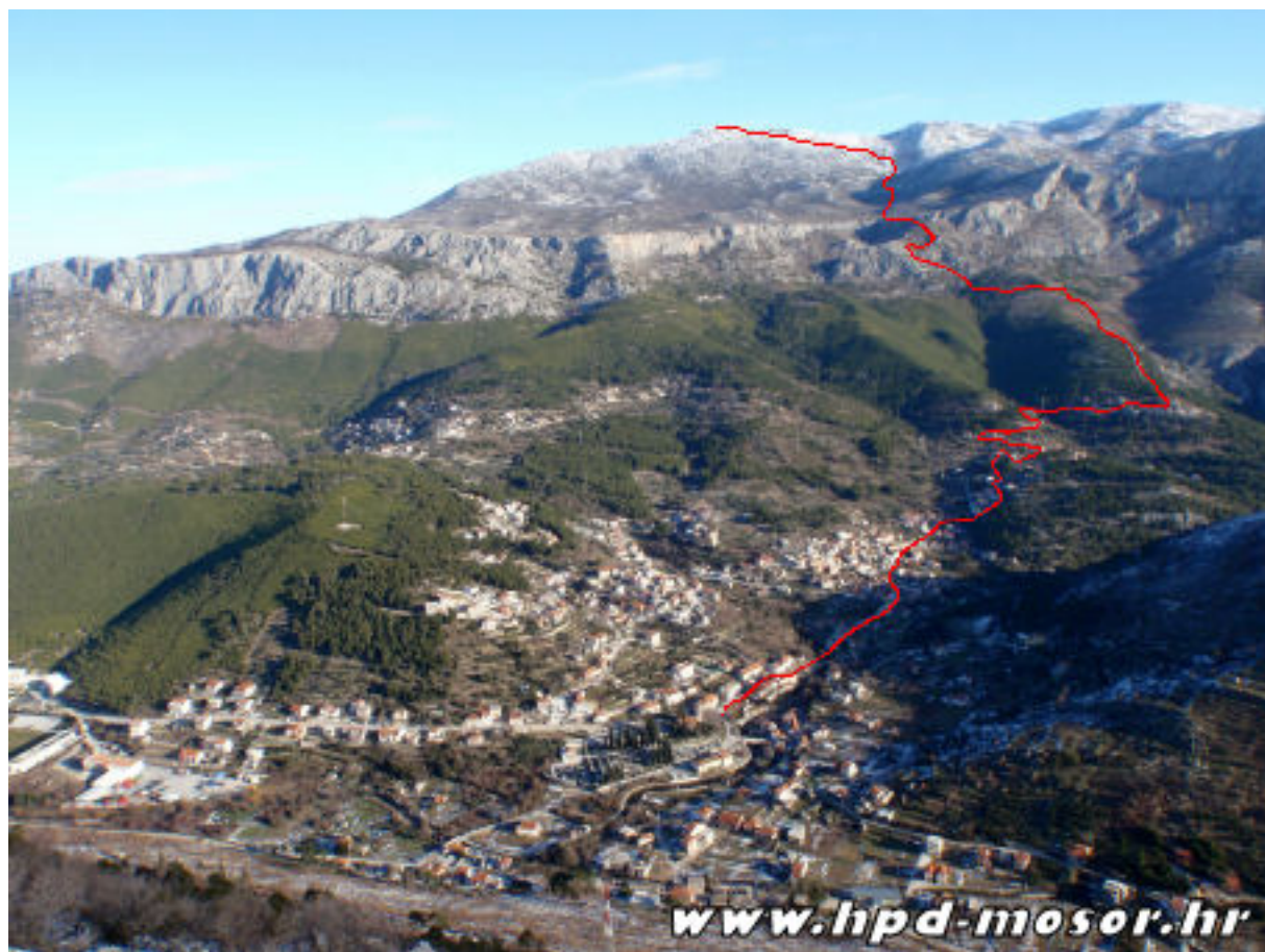
Sl. 2 Staza Žrnovnica - Debelo brdo