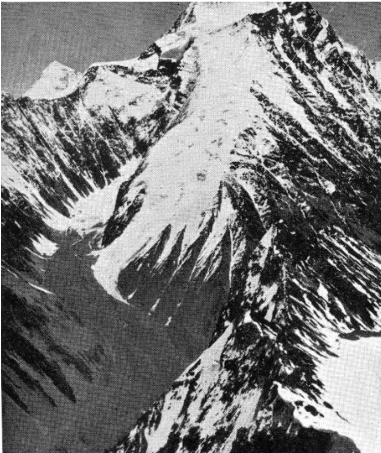
Zadanih sedam ljudi, među kojima su bili i Američanin i Rus, izbor se