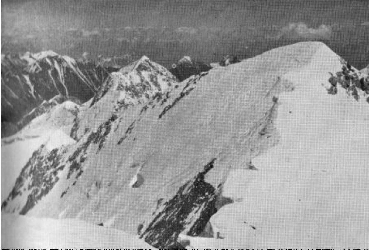
Prvi uspjeh u osvajanju vrha 1953. godine. Na vrhu su stajali britanski alpinisti Edmund Hillary i tenzinski Činabjezje Džengze