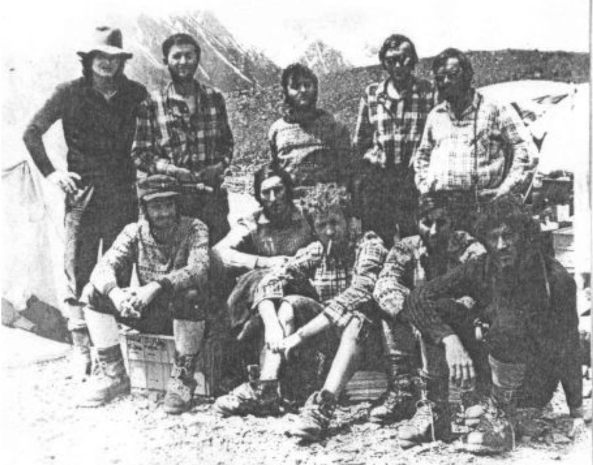
Na planini Džungla 7500 metara visine. Činabjezje Džengze i britanski alpinisti, a od 1953. godine alpinisti su