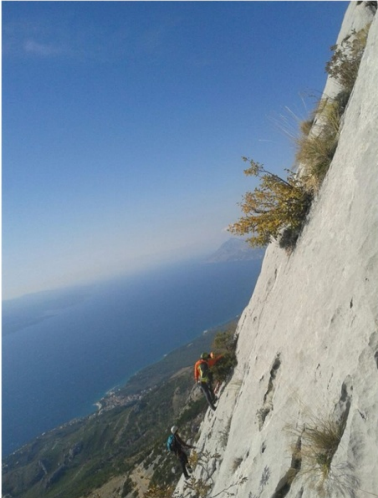
Savina, Spinač, Vijača i Kopač, a koje su najpoznatiji i najteži putevi za penjanje. Savina i Kopač su pedeset i pet godina stariji od Vijače i Spinača.