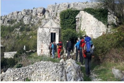
6. Tjedan alpinističke škole HPD Mosor