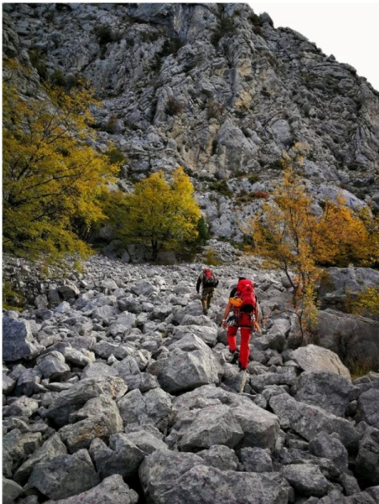
Polje pri klanjski vasi, pohod na vrh Zlatogorja. Na fotografiji sta hiteri po glavnem jasnem trinu