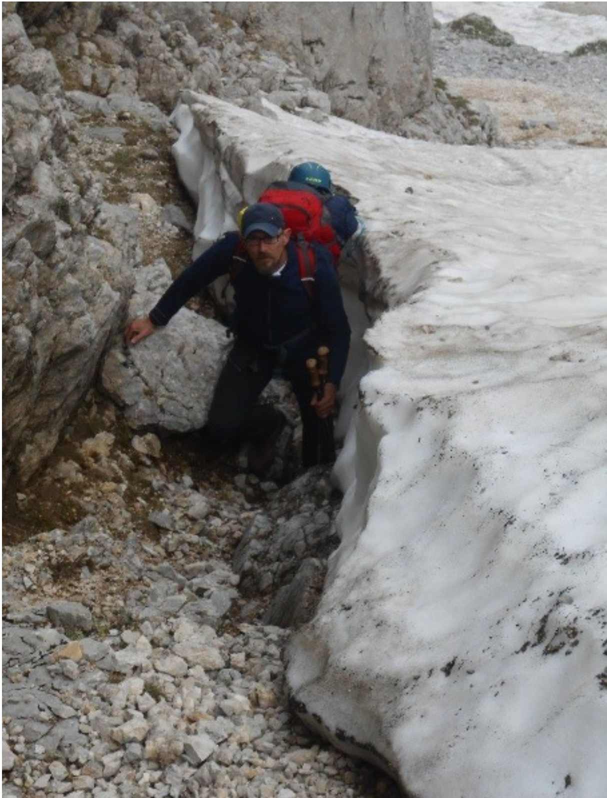
stena i spjezalo koje smo prije nekoliko dana priješli. Do sada je bilo vrlo hladno, ali sada je sunčano i vjetrovito. Na Škrlatici je sada vrlo hladno i vjetrovito.