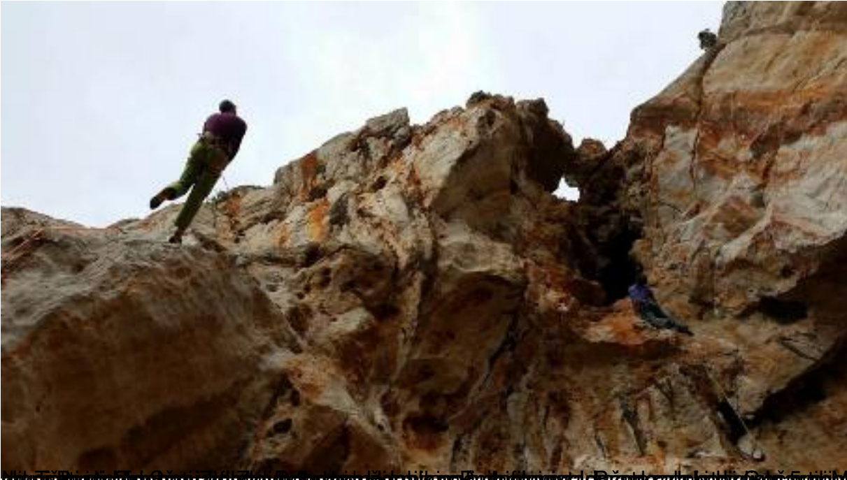
Učesnici na prednjem zidu, zasluga za uspešno završetak. Džabrovaletta, 6a-5, 5.11.14, 18.02.17