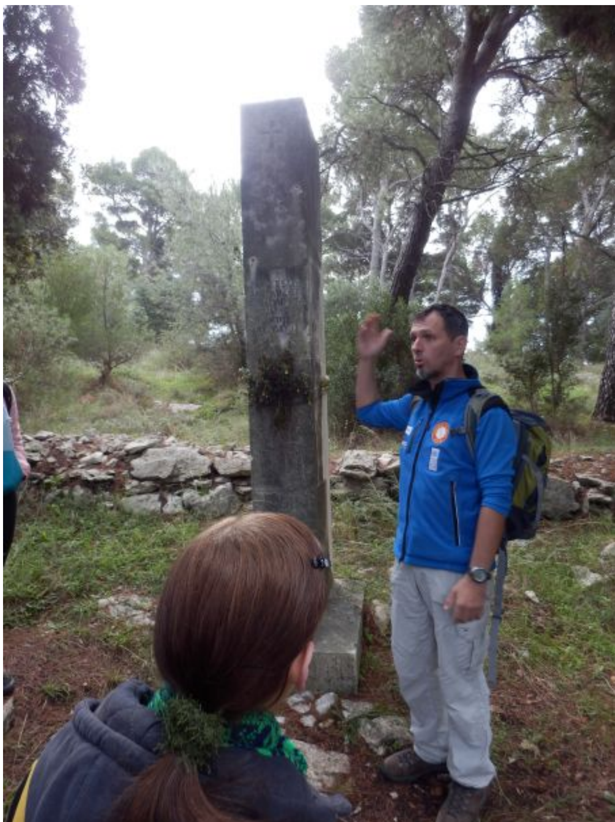
Slušačica pri objašnjenju značenja stupa na Marjanu.