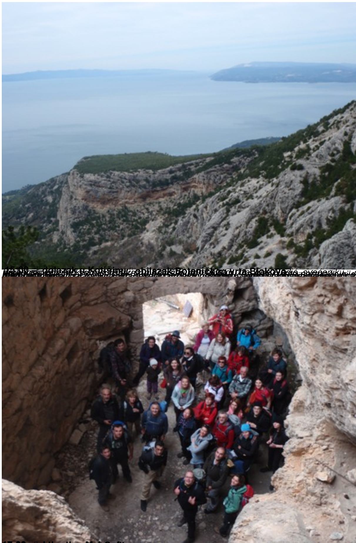
18:00 – Dolazak u Štarku