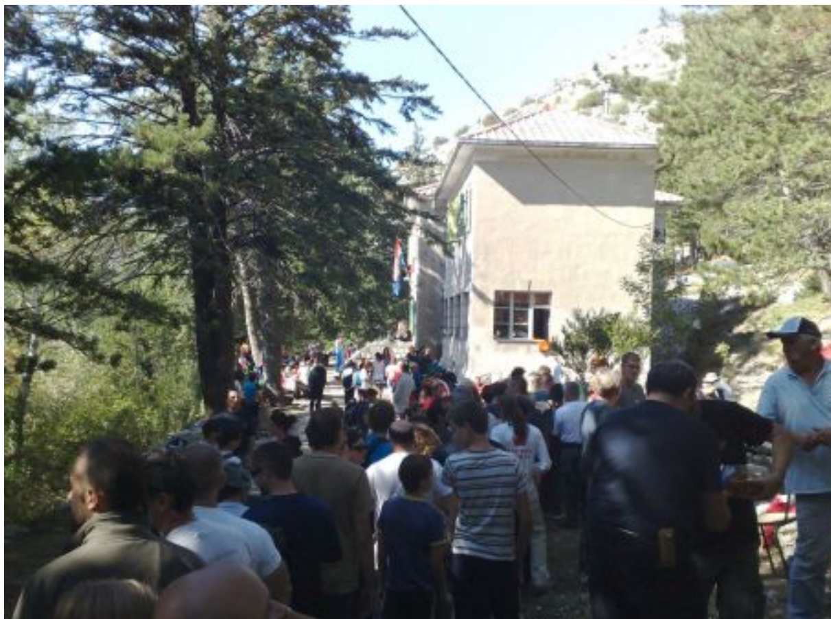
početni krancuski godišnjeg Festivala slika današnjeg društva u Gosvama pri pri-